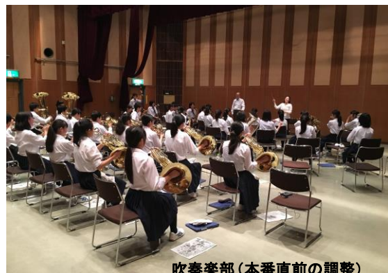
吹奏楽部(本番直前の調整)