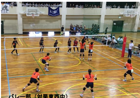
バレー部(対栗東中西)